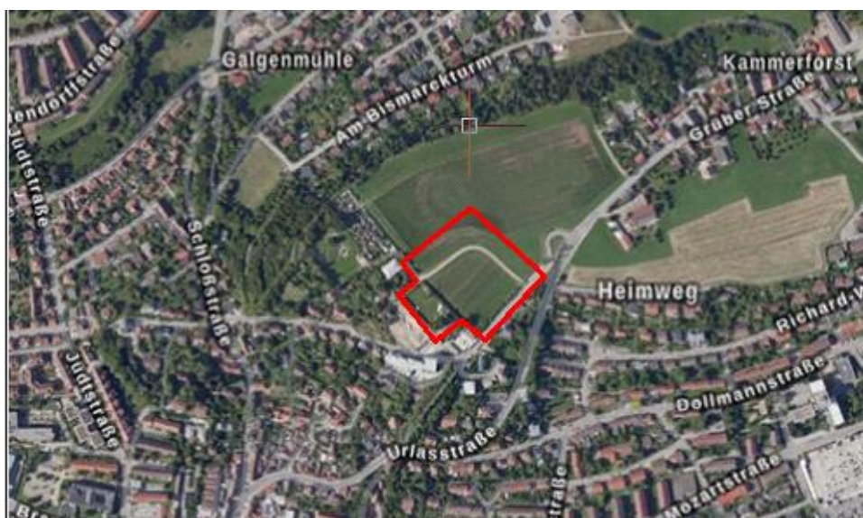
Abbildung 1: Luftbild - Lage des Plangebiets im Stadtgebiet (maßstabslos, Geoportal Bayern, 2023)

Das Plangebiet der Änderung des Flächennutzungsplans im Deckblatt Nr. 36 „für einen Teilbereich Am Drechselsgarten“ liegt nordöstlich des Altstadtgebiets Ansbachs.