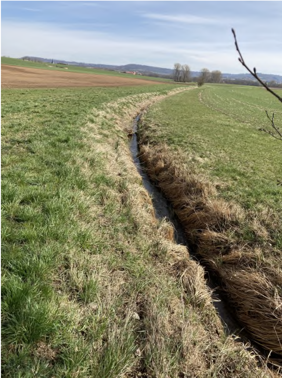
Abbildung 2: Randstreifenpflichtiges Kleingewässer bei Gebattel